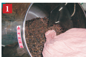
洗浄機にタネを投入