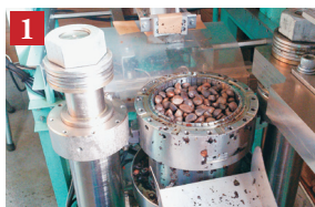
タネを圧搾搾油機に入れる