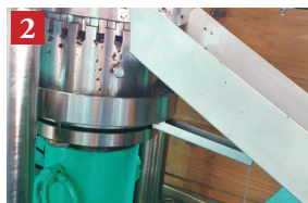
ゆっくりと圧搾する