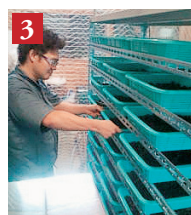
乾燥室で15時間乾燥させる